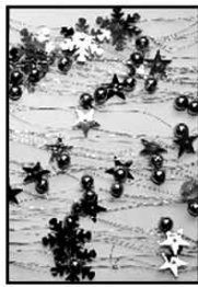
Garlande ca. 130 cm nur € 1,20/Stück