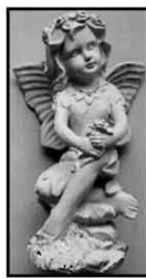
Elfe ca. 17 cm nur € 2,50 / Stück