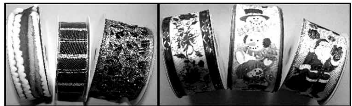
Dekoband-Rollen in diversen Breiten, Längen und Motiven zum Textil-Müller Superpreis!