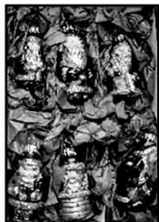
Hochwertiger Glas-Schmuck von € 2,50 bis € 6,- je Pkg