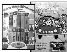
100e verschiedene Kinder- Bücher um nur € 4,-/KG