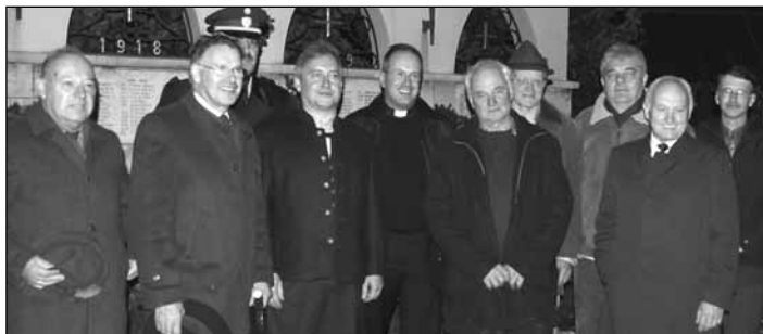
Gäste bei der Hubertusfeier (v.l.):