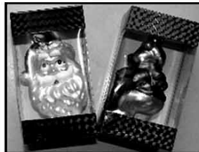
Glas-Schmuck ca. 8 cm nur € 1,50/Stück