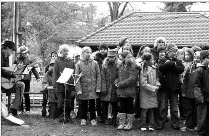
Kinderchor der Volksschulen Kritzensdorf sorgten für die musikalische Unterhaltung