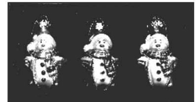
Glas-Schmuck ca. 8 cm 3er Packung nur € 4,50 / Pkg