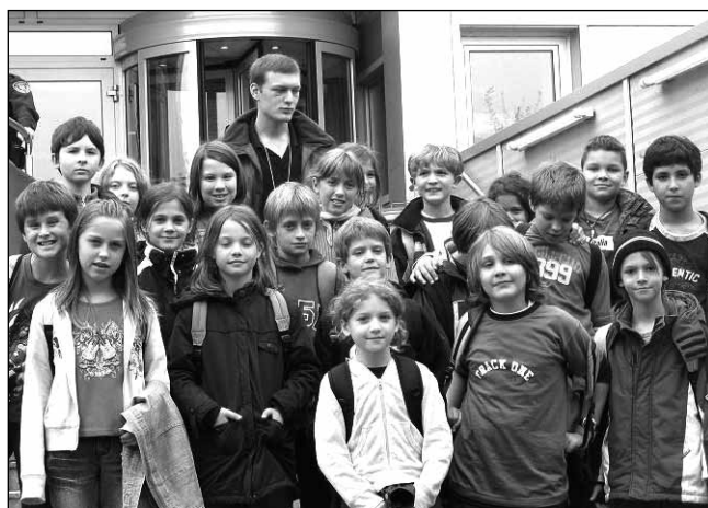
Die 4. Klasse der VS Kritzendorf in Wien

Das Beobachten und Begleiten der Kinder bereitete den Klassenlehrerinnen viel Freude. Das gemeinsame Arbeiten trgt sehr zum sozialen Lernen der Kinder bei, frdert die Geduld und das Verstndnis fureinander. Diese Woche war auf jeden Fall eine schne Erfahrung fr alle Beteiligten und es wird bestimmt weitere solche Tage geben.