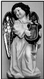
Engel ca. 23 cm nur € 6,-/Stück

UNSERE ÖFFNUNGSZEITEN: Montag bis Freitag 9 h bis 18 h Samstag 9 h bis 17 h