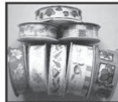
BÄNDER 100e Varianten zu TM-Preisen