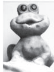
FROSCH ca. 15 cm nur € 3,- je Stück