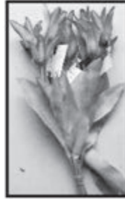
MINI-TULPEN ca. 25 cm nur € 0,30 je Stück