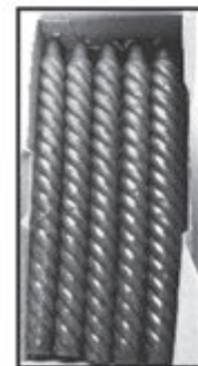
KERZEN in vielen Variationen ab € 0,20 je Stück