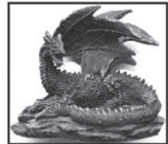
DRACHE ca. 9 cm hoch nur € 2,- je Stück