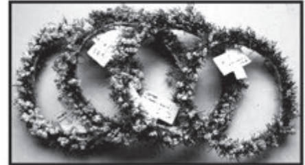
SPRENGERIE-KRANZ ca. 10 cm Dm. nur € 1,- je Stück