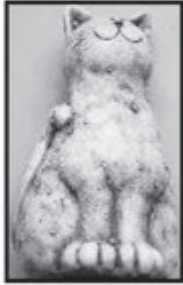
KERAMIK-KATZE ca. 18 cm nur € 2,50 je Stück

UNSERE ÖFFNUNGSZEITEN: Montag bis Freitag 9 h bis 18 h Samstag 9 h bis 17 h