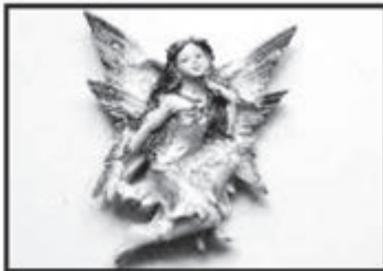
ELFE ca. 9 cm, mit Magnet nur € 1,20 je Stück.