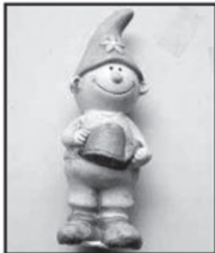
ZWERG ca. 12 cm nur € 1,- je Stück