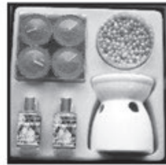
RELAX - SET Potpourri nur € 4,- je Set