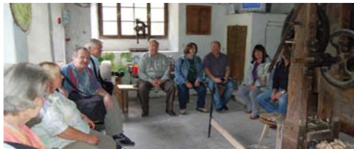
Müde warten wir auf die Vorführung in der „Drechserei am Erlach“

Durch das Museumsdorf fließt nämlich der Trattenbach, der durch mehrere Wehranlagen aufgestaut wird, um mit dem aufgestauten Wasser einige Wasserräder anzutreiben. Die nächste Station war das „Museum in der Wegscheid“, wo wir Interessantes über die Geschichte des Dorfes und die Feitelherzeugung erfuhren. Die nächste Station war die „Schleife am König“. Dort ist noch das originale Hammerwerk in Betrieb, mit dem die Messerklingen gehärtet werden und dann mit einem riesigen Schleifstein geschliffen werden. Dann ging es weiter zur „Drechserei am Erlach“, wo uns die Erzeugung der Feitelgriffe anschaulich erklärt und vorgeführt wurde. Nach dieser anstrengenden Führung, Gehstrecke 1,5 km leicht bergauf und 2 1/2 Stunden Dauer hatten wir uns eine Rast in der