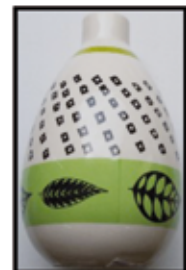
KERAMIK-VASE „Safari“ ca. 11 cm hoch nur € 1,50 / STK