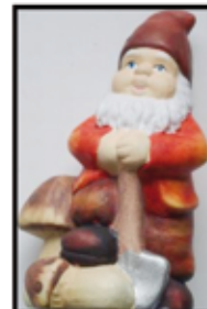
ZWERG ca. 16 cm hoch nur € 1,20/STK