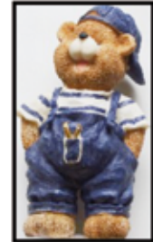
BÄR ca. 18 cm hoch nur € 2,- / STK