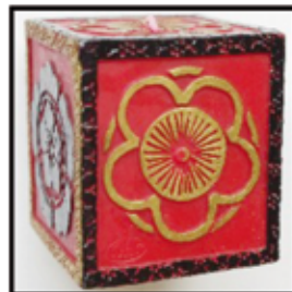
SÄULEN -KERZE „Dynasty“, ca. 8 cm hoch nur € 1,20/ STK