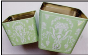
BLUMEN-TÖPFE Metall, 2er-Set ca. 8/12 cm hoch nur € 1,20 / SET

UNSERE ÖFFNUNGSZEITEN: Montag bis Freitag 9 h bis 18 h Samstag 9 h bis 17 h