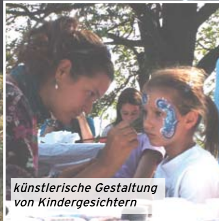
künstlerische Gestaltung von Kindergesichtern