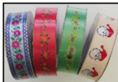
SCHMUCK - BAND bedruckt ca. 3 cm breit / ca. 45 lfm nur € 0,70 / ROLLE