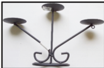
KERZEN-STÄNDER 3-armig, aus Metall ca. 20 cm hoch nur € 2,- / STK