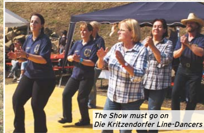
The Show must go on Die Kritzendorfer Line-Dancers