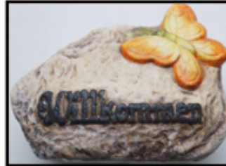
STEIN „Butterfly“ ca. 12 cm nur € 3,50/STK