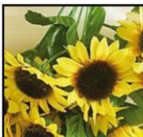
DEKO- SONNEN-BLUME ca. 80/85 cm nur € 2,- / STK