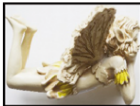
ELFE ca. 14 cm hoch ca. 20 cm lang nur € 3,50/STK