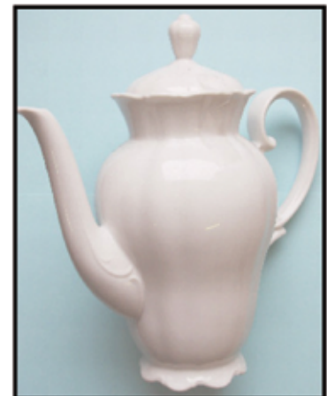
WEISSES PORZELLAN ca. 22 cm hoch nur € 6,- / Stk