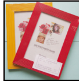
HOLZ- BILDERRAHMEN ca. 10 x 15 cm nur € 1,50 / Stk