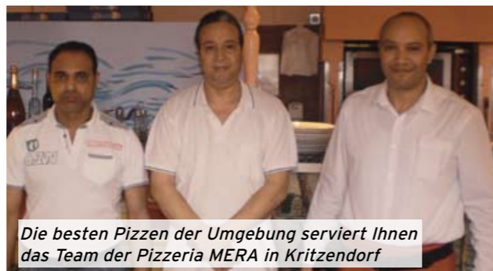
Die besten Pizzen der Umgebung serviert Ihnen das Team der Pizzeria MERA in Kritzendorf

Zu diesem Jubiläum präsentierte sich das Lokal im neuen Kleid. Komplett renoviert und attraktiv gestaltet – ergibt sich in der Mera eine angenehme Lokalatmosphäre. Der große Saal eignet sich hervorragend für Veranstaltungen jeder Art. Im Rahmen der Geburtstagsaktion lockte die Pizzeria zahlreiche Gäste an.