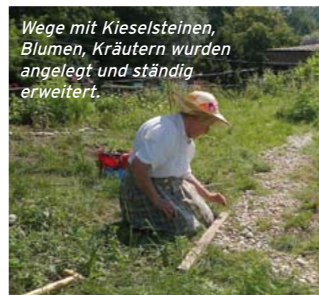
Wege mit Kieselsteinen, Blumen, Kräutern wurden angelegt und ständig erweitert.

Unsere Kontaktadresse: Edith Czernilovsky (Vereins-Obfrau) Kritzendorf, Oberer Durchschlag 7 Telefon 0676-88874500