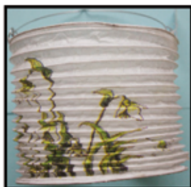
PAPIER- LAMPION ca. 15 cm Dm. nur € 0,70 / Stk