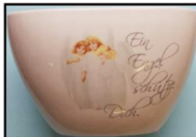
SCHUTZ-ENGEL-SCHALE ca. 16 cm nur € 2,- / Stk

Und viele andere Marken-Porzellan-Artikel!