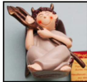
POLY-BÄNGEL diverse Modelle nur € 1,- / Stk