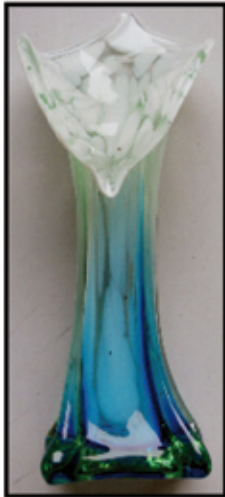
VASE ca. 19 cm hoch nur € 1,50 / Stk

UNSERE ÖFFNUNGSZEITEN: Montag bis Freitag 9 h bis 18 h Samstag 9 h bis 17 h