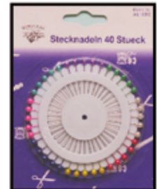
DIVERSES ZUBEHÖR 100erte Artikel nur € 0,70 / Pkg