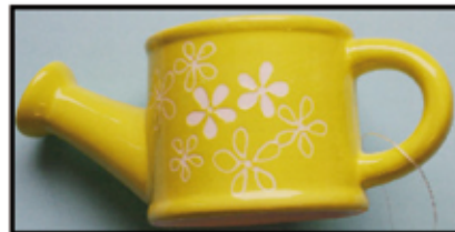
GIESS-KANNE, ca. 15 cm nur € 2,- / Stk