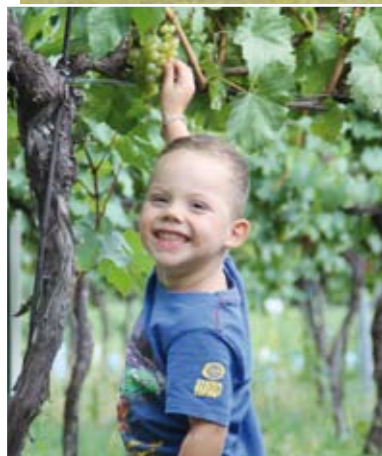
Hey, die sind ja schon süß ...