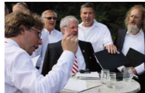
Die Sänger in bestechender Form