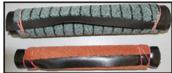
FUSS - ABSTREIFER ca. 40 x 60 cm orange | ca. 45 x 60 cm grau nur € 1,- / STK | nur € 4,- / STK

STORES 140 cm hoch STORES 290 cm hoch VORHANG-SEITENTEILE 150 cm hoch VORHANG-SEITENTEILE 280 cm hoch