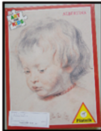
PUZZLE diverse Modelle ab € 3,- / PKG

UNSERE ÖFFNUNGSZEITEN: Montag bis Freitag 9 h bis 18 h Samstag 9 h bis 17 h