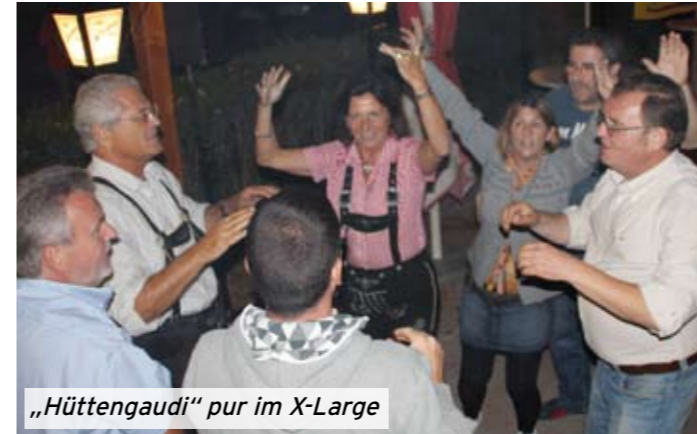
„Hüttengaudi“ pur im X-Large