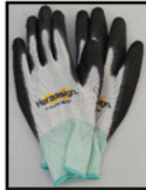
ARBEITS- HANDSCHUHE nur € 0,70 / PAAR