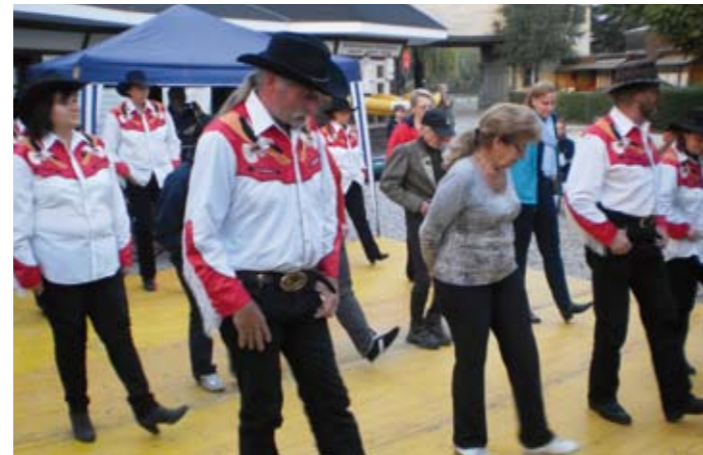
Die Line-Dancers motivierten das Publikum mitzumachen