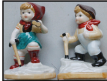
DEKO-FIGUR ca. 12 cm hoch nur € 1,20 / STK