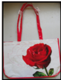
TASCHE ca. 22 x 33 x 52 cm diverse Motive nur € 2,50 / STK