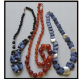
DIVERSER SCHMUCK 100erte Artikel nur € 2,- / STK