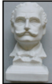
BÜSTE JOHANN STRAUSS ca. 13 cm hoch nur € 1,50 / STK