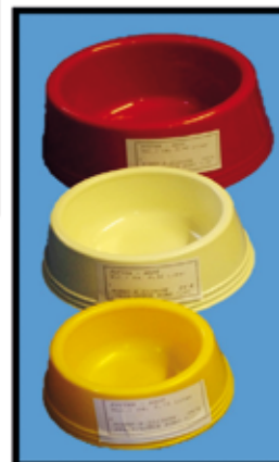
FRESS-NAPF div. Größen nur Euro 1,- bis Euro 1,50,-/STK