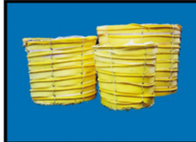
RATTAN-HOLZ-TÖPFE 3er-Set, Dm. 16 , 13 , 10 cm nur Euro 3,-/Set