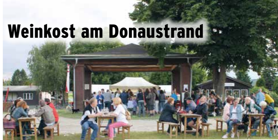
Die Kritzendorfer Winzer konnten mit der Veranstaltung auf alle Fälle zufrieden sein.