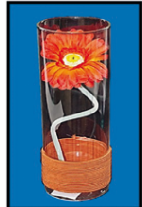
DEKO-VASE mit Blume ca. 30 cm hoch nur Euro 4,-/Stück

PORZELLAN Vasen , Kannen uvm. nur Euro 0,50 bis Euro 6,-/STK