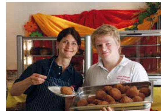
unten: Die berühmten Fleischlaberl