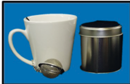
TEE-SET 3-teilig Tasse , Dose , Tee-Ei nur Euro 2,-/Set

UNSERE ÖFFNUNGSZEITEN: Montag bis Freitag 9 h bis 18 h Samstag 9 h bis 17 h