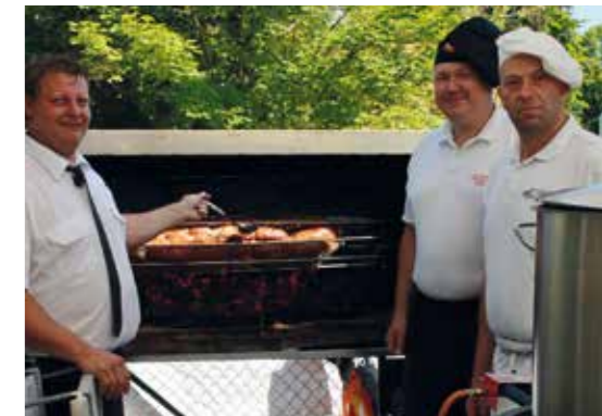
oben: Das Spanferkel war im Nu weg.