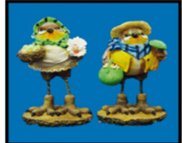
DEKO-ARTIKEL „Vogel“ ca. 16 cm hoch nur Euro 0,50/Stück

reichhaltiges Angebot an Kunst-Blumen , ab 0,30/Stück für Dekoration zu TEXTIL MÜLLER - Preisen