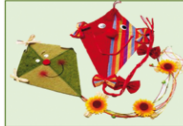
DEKO-DRACHEN diverse Modelle ca. 70 cm nur Euro 2,-/Stück