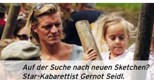
Auf der Suche nach neuen Sketchen? Star-Kabarettist Gernot Seidl.