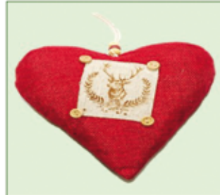
DEKO HERZ aus Stoff ca. 15 cm / Euro 1,20/Stück ca. 70 cm / Euro 3,50/Stück