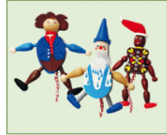
HAMPEL-MANN diverse Modelle nur Euro 2,50/Stück

reichhaltiges Angebot an Kunst-Blumen , ab 0,30/Stück für Dekoration zu TEXTIL MÜLLER - Preisen