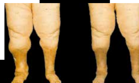
Starkgradige Phlep-Lymphödeme der Beine seit 40 Jahren vor und nach 4-wöchiger Ödemtherapie