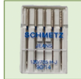
NÄH-MASHINEN NADELN nur € 0,70 / Pkg