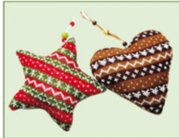
DEKO HERZ/STERN gestrickt ca. 15 cm / Euro 1,50/Stück ca. 18 cm / Euro 2,00/Stück

UNSERE ÖFFNUNGSZEITEN: Montag bis Freitag 9 h bis 18 h Samstag 9 h bis 17 h