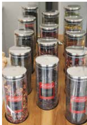
Die verschiedensten köstlichen Teemischungen