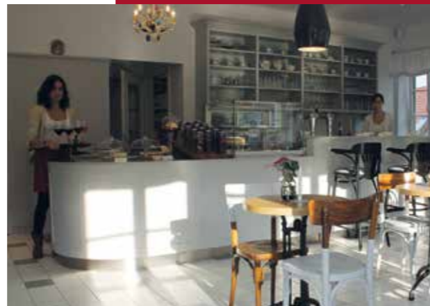
In dem hellen, sehr geschmackvoll eingerichteten Lokal muss man sich einfach wohlfühlen