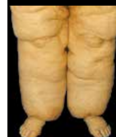
Lip-Lymphödem der Beine bei massiver Liphypertrophie und Adipositas