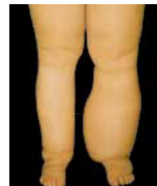
Beidseitige primäre Lymphödeme seit der Pubertät bei einer Frau mit 38 J.