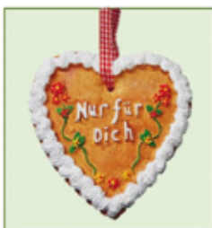
DEKO HERZ Keramik ca. 12,5 cm nur Euro 0,50/Stück

großes Sortiment an NÄHZUBEHÖR zum Beispiel