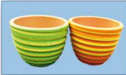
DEKO - TÖPFE diverse Modelle Dm 12 cm / 10 cm hoch nur € 0,70 / Stück

UNSERE ÖFFNUNGSZEITEN: Montag bis Freitag 9 h bis 18 h Samstag 9 h bis 17 h