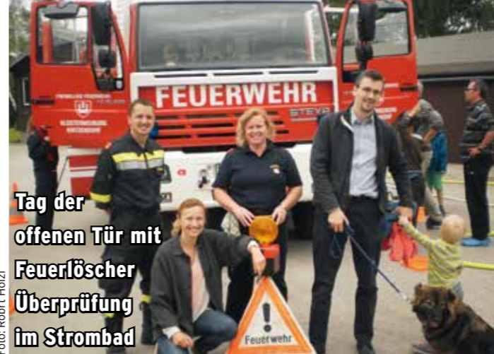
Tag der offenen Tür mit Feuerlöscher Überprüfung im Strombad

haus an der Hauptstraße gibt es eine „Außenstelle“ im Strombad, welche einen raschen Ersteinsatz auch hier sichert. Übrigens muss ein guter Teil des laufenden Betriebes aus Eigenmitteln der Feuerwehr getragen werden - daher benötigen wir Ihre Spende und ersuchen Sie um den Besuch des Feuerwehrheurigens. Diesmal mit Livemusik, Schmankerln und einer Feldmesse samt Festakt am Sonntag. Dabei wird der 125 jährigen Geschichte ebenso gedacht wie ein Schritt zur Modernisierung der Ausrüstung gesetzt.