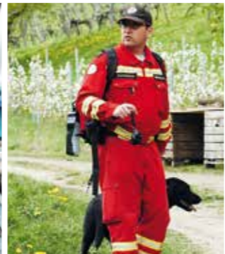
Für eine interessante Vorführung sorgte die Rettungshundebrigade