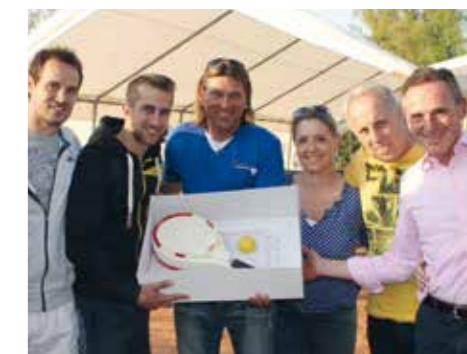
Eine Überraschungstorte von den Freunden durfte natürlich nicht fehlen