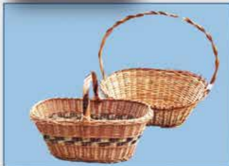
KÖRBE diverse Modelle nur € 4,- bis € 5,-/

Garten-Auflagen und Schirme in großer Auswahl zu TEXTIL MÜLLER - Preisen