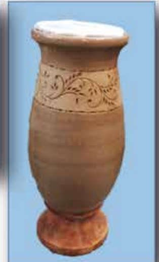
VASE ca. 13 cm Dm 42 cm hoch nur € 15,- / Stück