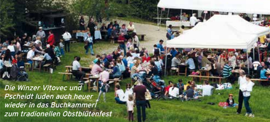
Die Winzer Vitovec und Pscheidt luden auch heuer wieder in das Buchkammerl zum traditionellen Obstblütenfest