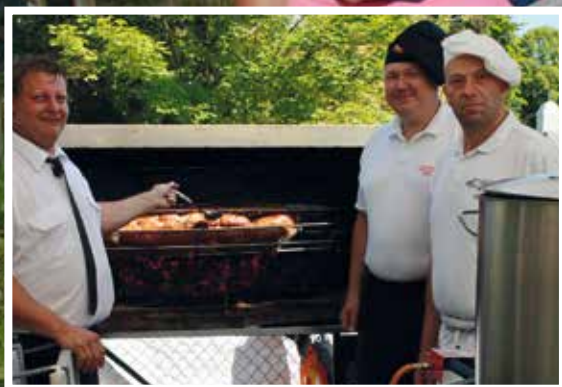
Das knusprige Spanferkel und die köstlichen Fleischlaberl werden auch beim heurigen Feuerwehrheurigen vom 26. bis 28. Juni nicht fehlen