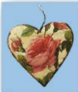
BLECH-HERZ ca. 10 x 10 cm nur € 0,50 / Stück

Garten-Auflagen und Schirme in großer Auswahl zu TEXTIL MÜLLER - Preisen