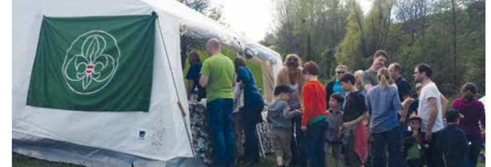
Beliebt bei Jung und Alt: die Palatschinken der Kritzendorfer Pfadfinder beim Obstblütenfest

PfadfinderInnen Kritzendorf/Höflein 3420 Kritzendorf, Weißenhoferstraße 28-32