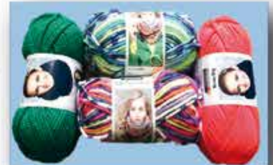
STRICK-WOLLE diverse Farben ca. 200 g nur € 4,- / Knäuel

reichhaltiges Sortiment an Nähzubehör zu TEXTIL MÜLLER - Preisen