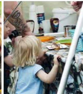
Ein Highlight für die Jüngsten: Palatschinken von den Pfadis