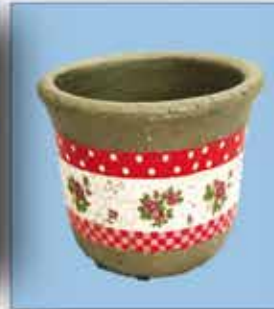
DEKO - TOPF „Patch“ ca. 15 cm Dm 11 cm hoch nur € 1,50 / Stück