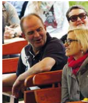
Wie jedes Jahr dabei: Fußball(Frauen)kenner Herbert Prohaska