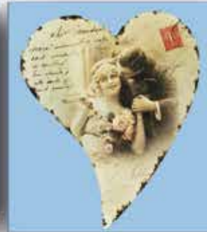
BLECH - HERZ ca. 21 x 27 cm nur € 2,- / Stück