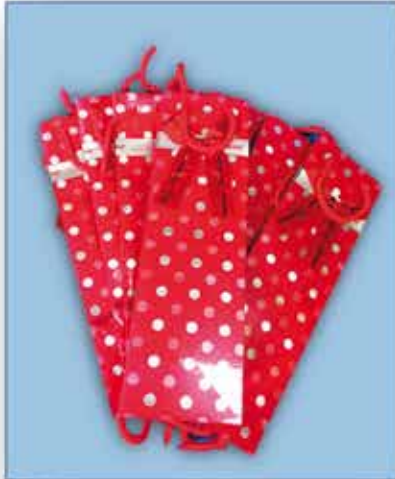
FLASCHEN - SACKERLN 1 Pkg = 10 Stück nur € 4,- / Packung

UNSERE ÖFFNUNGSZEITEN: Montag bis Freitag 9 h bis 18 h Samstag 9 h bis 17 h