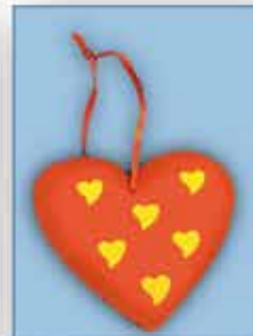
DEKO - HERZ ca. 12 cm Dm nur € 0,50 / Stück