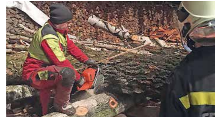
Der Umgang mit der Motorsäge wurde professionell geübt und die Atemschutzausbildung mit Bravour gemeistert.