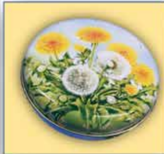
BLECH-DOSE ca. 12 cm Dm nur € 0,70 / Stück