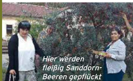
Hier werden fleißig Sanddorn-Beeren gepflückt