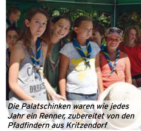
Die Palatschinken waren wie jedes Jahr ein Renner, zubereitet von den Pfadfindern aus Kritzenendorf