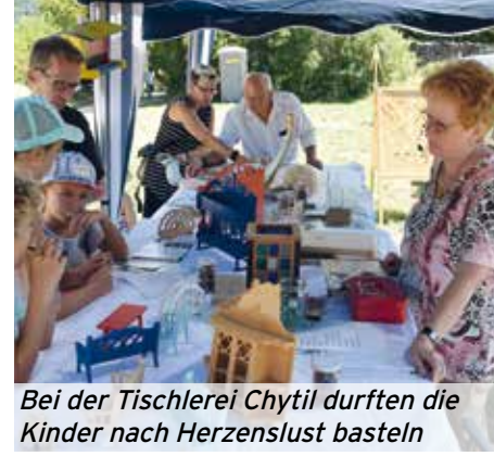
Bei der Tischlerei Chytil durften die Kinder nach Herzenslust basteln