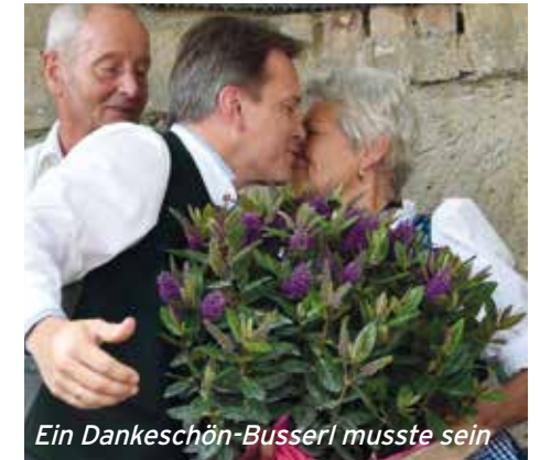
Ein Dankeschön-Busserl musste sein

Die Öffnungszeiten sind täglich von 11 bis 22 Uhr, kein Ruhetag. Von Montag bis Freitag gibt es ein Mittagmenü. Die Speisekarte bietet typische Wirtshausgerichte von Eiernockerln bis zum Zwiebelrostbraten von der Beiried. Kritzendorfer und Österreichische Weine sowie frisch gezapftes Bier aus der Stiftsbrauerei Schlägl runden das Angebot ab.