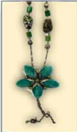
SCHMUCK / KETTE viele Modelle nur € 3,50 / Stück

UNSERE ÖFFNUNGSZEITEN: Montag bis Freitag 9 h bis 18 h Samstag 9 h bis 17 h