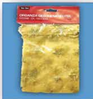
ORGANZA-SACKERL ca. 13 x 18 cm 1 Pkg = 3 Stück nur € 1,20 / Packung