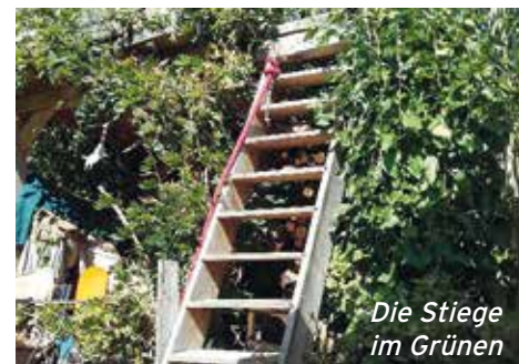
Die Stiege im Grünen