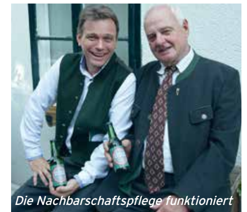
Die Nachbarschaftspflege funktioniert