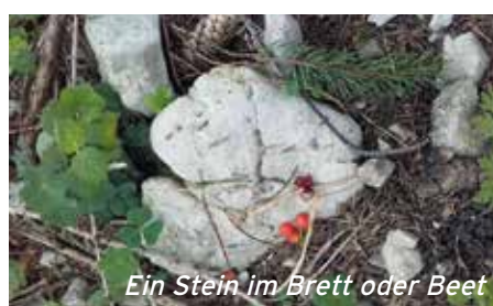
Ein Stein im Brett oder Beet

Besuchen Sie uns im Kräuterstübchen, am Bahnsteig 2 direkt neben dem Warteraum. www.natur-kunst-vermittlung.at