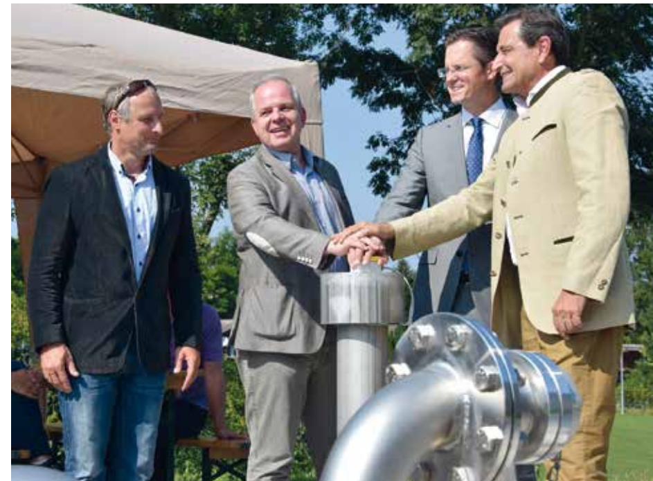
oben: ein gemeinsamer Druck auf den roten Knopf und schon floss klares Wasser aus allen Rohren. unten: Hightech im Inneren des Brunnenhauses.