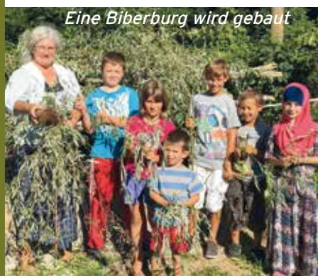
Eine Biberburg wird gebaut