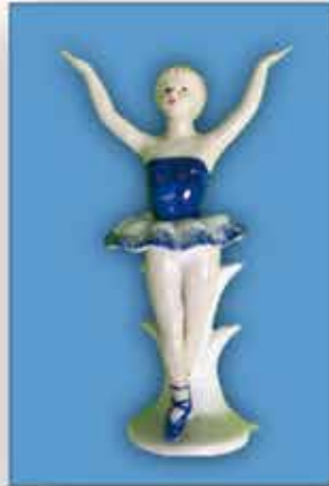
PORZELLAN-FIGUR ca. 19 cm nur € 1,50 / Stück