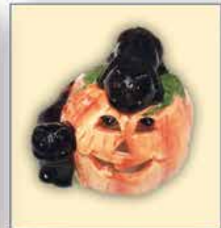
VIELE HALLOWEEN-DEKO-ARTIKEL zB. „Kürbis“ nur € 0,70 / Stück