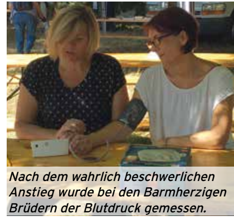
Nach dem wahrlich beschwerlichen Anstieg wurde bei den Barmherzigen Brüdern der Blutdruck gemessen.