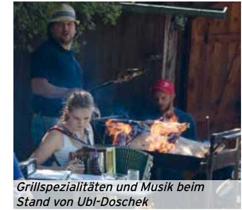
Grillspezialitäten und Musik beim Stand von Ubl-Doschek