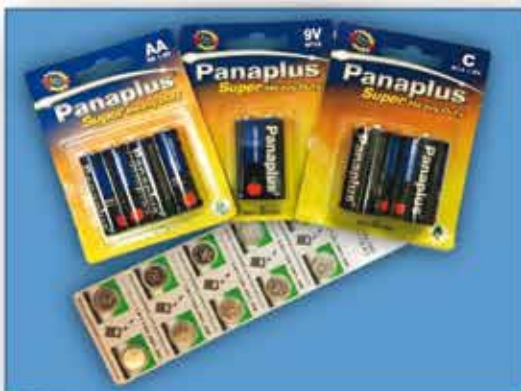
BATTERIEN : AA / AAA 9V / Mignon Knopf-Batterien in großer Auswahl nur € 1,20 / Packung