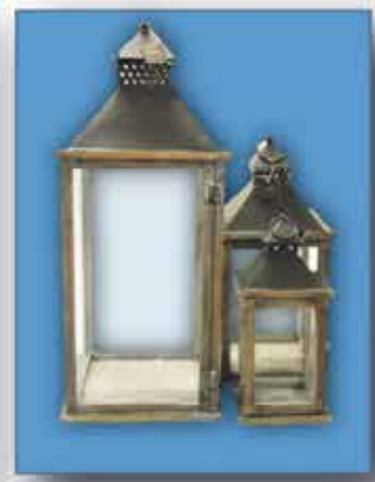
LATERNEN klein 37 cm / € 16,-/ Stück mittel 50 cm / € 27,-/ Stück Groß 70 cm / € 37,-/ Stück