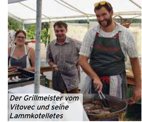
Der Grillmeister vom Vitovec und seine Lammkotelettes