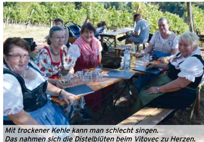
Mit trockener Kehle kann man schlecht singen. Das nahmen sich die Distelblüten beim Vitovec zu Herzen.