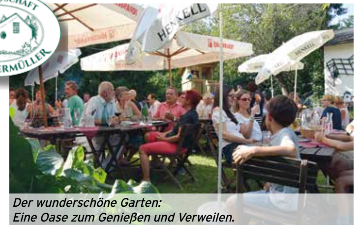
Der wunderschöne Garten: Eine Oase zum Genießen und Verweilen.