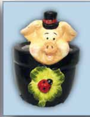
NEUJAHR ca. 10 cm nur € 1,50/Stück