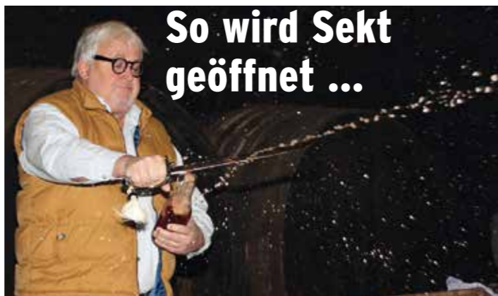
So wird Sekt geöffnet ...