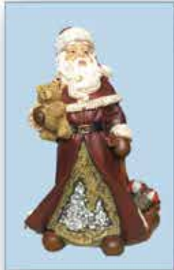
DEKO-FIGUR ca. 20 cm nur € 5,-/Stück

UNSERE ÖFFNUNGSZEITEN: Montag bis Freitag 9 h bis 18 h Samstag 9 h bis 17 h