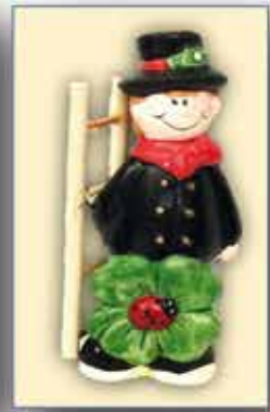
NEUJAHR ca. 10 cm nur € 1,-/Stück