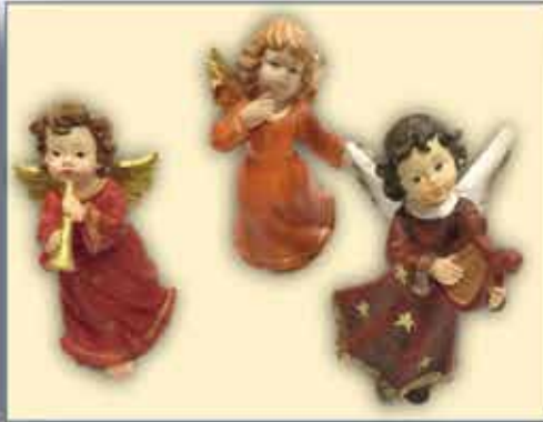
ENGEL div. Modelle nur € 1,-/Stück