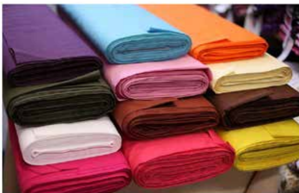
BAUMWOLLE UNI - 100% BW 140-150 cm breit nur € 3,50 / lfm

Europaweit einzigartige Auswahl an Stoffen, Nähzubehör, Dekoartikeln und vielem mehr zu einem unschlagbaren PREIS - LEISTUNGS - VERHÄLTNIS