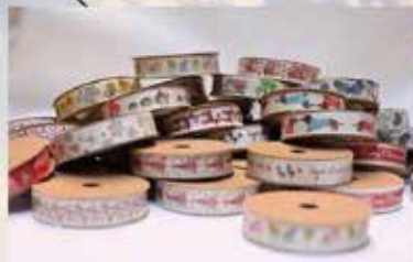
DEKO-BAND ca. 10 lfm nur € 2,85 / Stk

UNSERE ÖFFNUNGSZEITEN: Montag - Freitag: 9:00 bis 18:00 Samstag: 9:00 bis 17:00