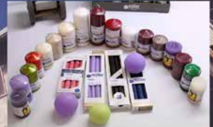
MÜLLER QUALITÄTSKERZEN nur € 5,- / kg