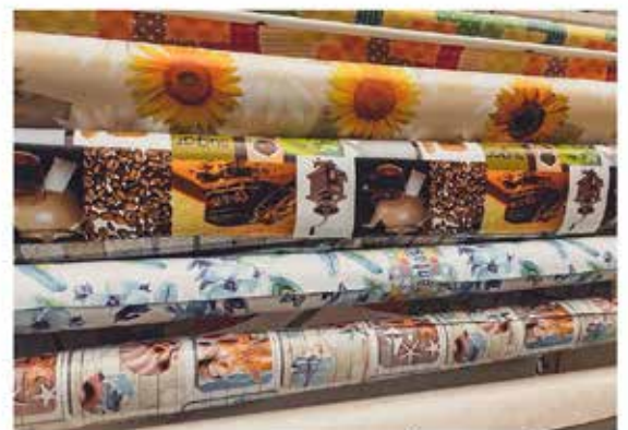
WACHSTISCHTÜCHER 140, 160 cm breit ab € 3,- / lfm