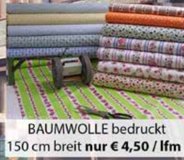
BAUMWOLLE bedruckt 150 cm breit nur € 4,50 / lfm

Europaweit einzigartige Auswahl an Stoffen, Nähzubehör, Dekoartikeln und vielem mehr zu einem unschlagbaren PREIS - LEISTUNGS - VERHÄLTNIS