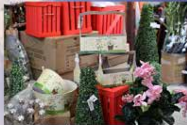
QUALITÄTS DEKOARTIKEL zu unschlagbaren Preisen!