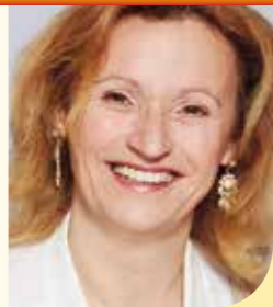
Liebe Kritzendorferinnen und Kritzendorfer!

„Es ist jedes Mal unglaublich, wie schnell so ein Jahr vergeht. Ich darf Ihnen wieder unsere vielen, abwechslungsreichen Veranstaltungen präsentieren, die die Weihnachtszeit in unserem Dorf entstressen und verschönern sollen. Es steckt viel Arbeit und Zeit dahinter, von den engagierten Personen in den verschiedenen Vereinen, der Freiwilligen Feuerwehr und der Pfarre, aber zum Glück gibt es noch diesen Zusammenhalt in unserem Dorf.