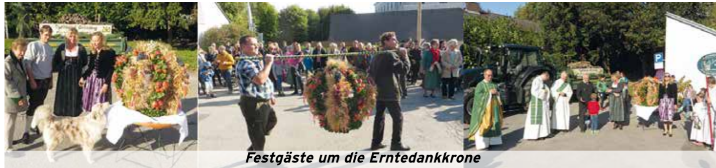
Festgäste um die Erntedankkrone

Die Kinder der ÖVS und der Vituschor sangen uns in Feststimmung.