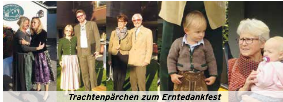
Trachtenpärchen zum Erntedankfest