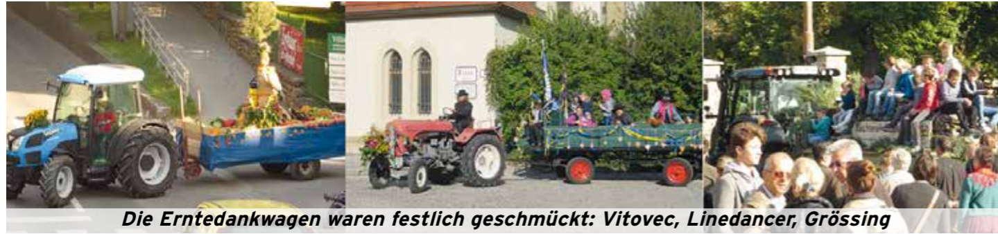
Die Erntedankwagen waren festlich geschmückt: Vitovec, Linedancer, Grössing