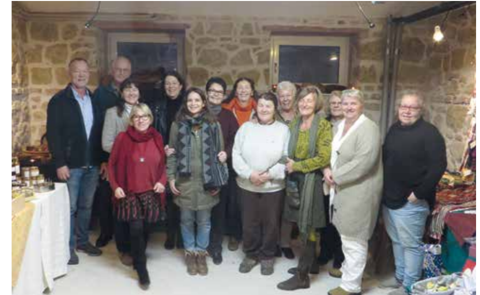
Die Protagonisten mit ihren Kunsthandwerken im Pfarrhauskeller

Kritzendorf - eine gute Gelegenheit das Leben im Dorf zu genießen.