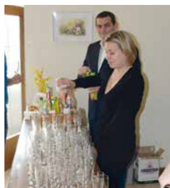
Fleißige Helferinnen und Helfer kümmern sich um das Wohl der Gäste