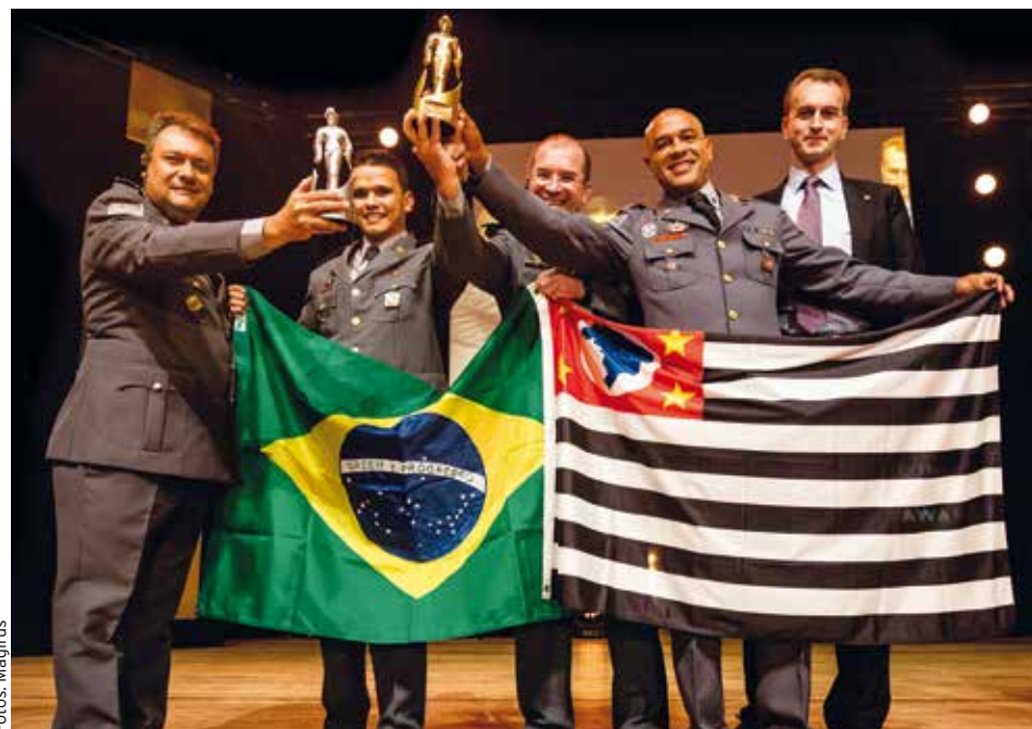
Das Team der Brasilianischen Berufsfeuerwehr freute sich über den Oscar der Feuerwehrbranche

Feuerwehren aus aller Welt strömten im März 2019 in das Congress Centrum Ulm. Zum sechsten Mal in Folge wurde hier der Conrad Dietrich Magirus Award, auch bekannt als der „Oscar der Feuerwehrbranche“, vergeben. Mit dabei auch die Freiwillige Feuerwehr Kritzendorf, die nach einem Zugunglück im Dezember 2017 mehr als 30 Personen aus umgestürzten Waggons befreien musste und für die herausragende Rettungsleistung geehrt wurde. Besonders freuen durfte sich in diesem Jahr die Feuerwehr São Paulo, die für ihren Einsatz bei einem Hochhausbrand als „Internationales Feuerwehrteam des Jahres 2018“ ausgezeichnet wurde.