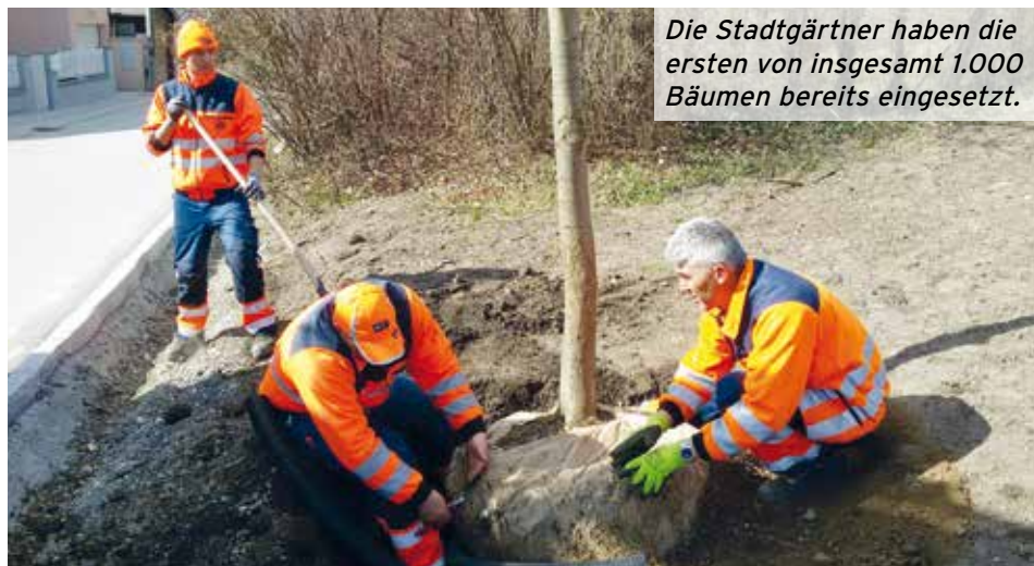
Die Stadtgärtner haben die ersten von insgesamt 1.000 Bäumen bereits eingesetzt.

Auch wenn die Wienerwaldgemeinde rundum über großzügigen Erholungsraum verfügt, gibt es dennoch Stadtteile, die hier Nachholbedarf haben. Das Projekt „1.000 Bäume für Klosterneuburg“ schafft über die Dauer von fünf Jahren nachhaltige Natur in Form von wertvollen Klimaschützern. Ein Teil davon, rund 55, sind vom Stadtgartenamt selbst gezogene Bäume. Sie stammen von der Baumschule auf dem Haschhof. Die tausend neuen Bäume sind alle heimische Gehölze, darunter Linde, Hainbuche, Birke, Ahorn, Walnuss, Kornelkirsche, Hainbuche u.v.m. Standorte sind z.B. auf dem hinteren Park & Ride Parkplatz beim Bahnhof Kierling, der kleine Park in der Leopoldstraße bei der Weinpresse, der Vivenotweg oder der Spielplatz Rogeggergasse in Weidling. Am Bahnhof Unterkritzendorf gibt es eine größere Auspflanzung.