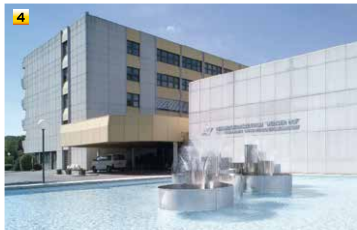
Dieser Artikel ist, ergänzt um Fußnoten, wie alle Beiträge zu „Kritzendorf History“, unter www.komitee-kritzendorf.com/ - Dorfmuseum - Archiv einsehbar.