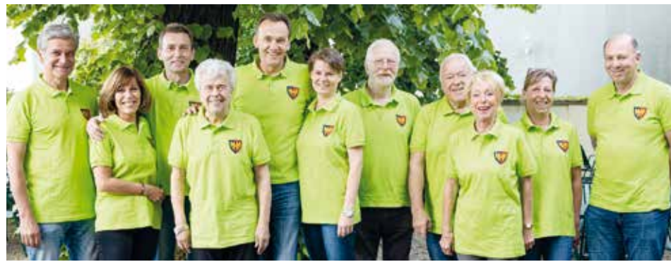
oben: die Organisatoren freuen sich über ein gelungenes Dorffest.