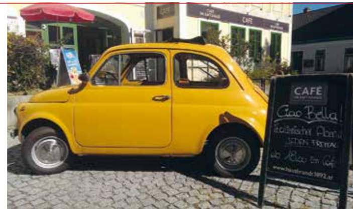
Italienischer Flair breitet sich jeden Freitag im Kritzendorfer Amtshaus aus