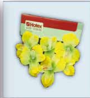
STREU - BLUMEN 1 PKG = 6 Stück nur € 0,70 /Packung