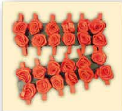
ROSEN auf KLAMMERN 1 PKG = 24 Stück nur € 2,50 /Packung

...und noch viele weitere Modelle bei Textil-Müller