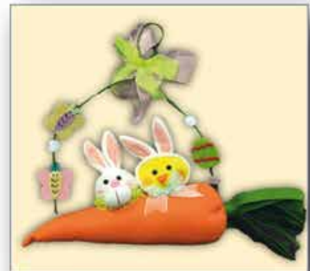
OSTER - DEKO zum Hängen ca. 33 cm nur € 5,- /Stück

CARNEVALL-STOFFE in großer Auswahl zu unschlagbaren TEXTL MÜLLER - Preisen nur Euro 2,- /Lfm bis Euro 4,- /Lfm