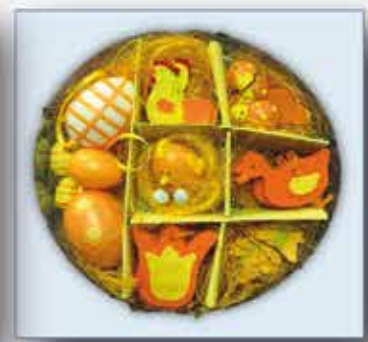
OSTER - DEKO - SET nur € 3,- /Packung

...und noch viele weitere Modelle bei Textil-Müller