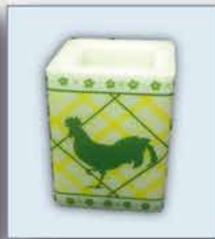
KERZE ca. 7 x 10 cm nur € 1,20 /Stück