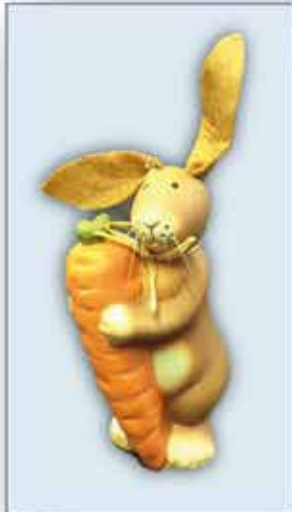
DEKO - HASE ca. 12 cm nur € 1,- /Stück

UNSERE ÖFFNUNGSZEITEN: Montag bis Freitag 9 h bis 18 h Samstag 9 h bis 17 h