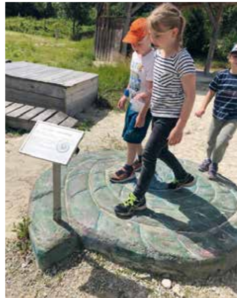
VS Weidling führen die Kinder auch in das Abenteuer Pielachtal, wo es zur Schatzsuche ging. Ausgerüstet mit

Schatzkarten versuchten sie, beim Goldwaschen Rubine, Smaragde, Gold oder Edelsteine zu finden. In der Spiel- und Ruhezone kam die Erholung ebenfalls nicht zu kurz.