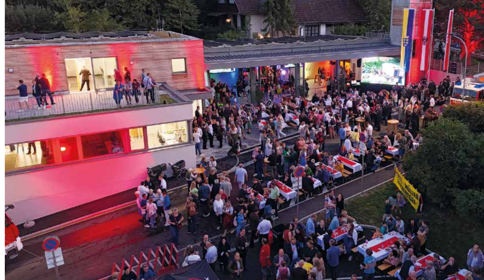
Bis spät in die Nacht wurde die Eröffnung des neuen Feuerwehrhauses gefeiert. Der „harte Kern“ blieb sogar bis in die frühen Morgenstunden! Die Mannschaft der FF Kritzendorf bedankt sich bei allen für die tolle Unterstützung.