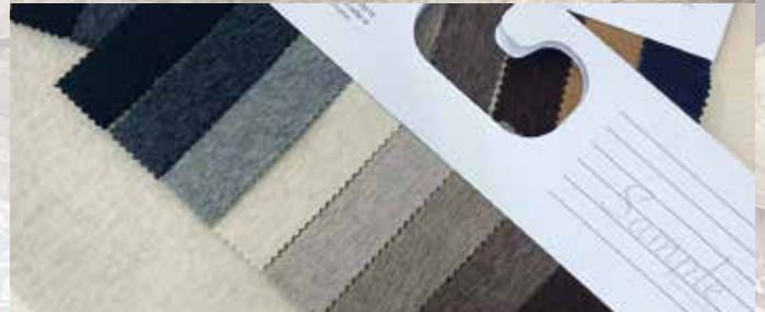
WOLL-DOUBLE deluxe (Kaschmir) nur € 30,- / lfm