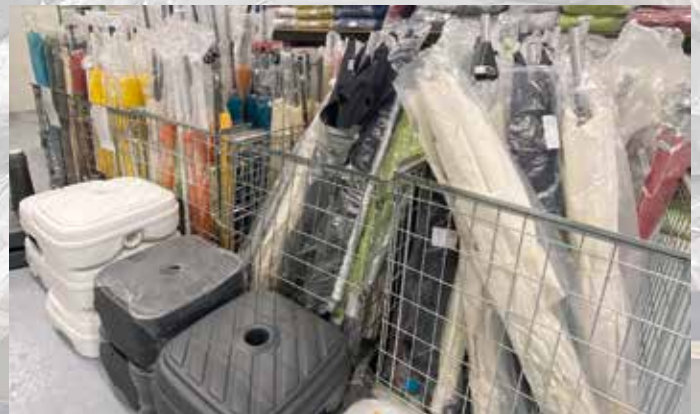
DOPPLER-GARTENSCHIRME UND ZUBEHÖR Riesen Auswahl zu unschlagbaren Preisen