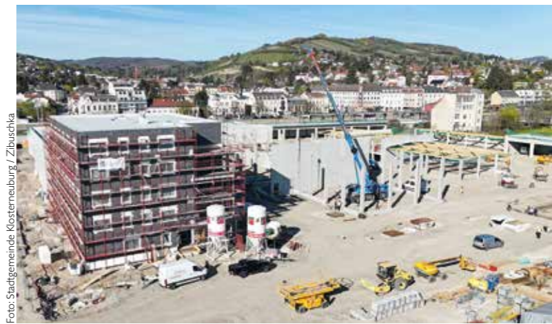
Die Großbaustelle kann weitaus früher als geplant abgeschlossen werden, schon im Spätherbst soll die Bauabteilung einziehen.

Aufgrund des raschen Baufortschritts ist mit der Fertigstellung und der Übersiedlung von Verwaltung und Wirtschaftshof be-