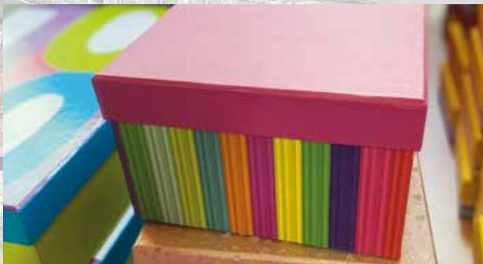
GESCHENKBOXEN in verschiedenen Größen und Designs zu unschlagbaren Textil Müller Preisen