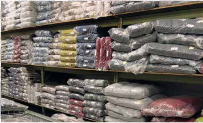
DOPPLER GARTENMÖBELAUFLAGEN Riesenposten an Nieder- und Hochlehner, Relax- und Rollliegenauflagen, Sitzkissen, Palettenkissen etc...

UNSERE ÖFFNUNGSZEITEN IN KRITZENDORF: Montag – Freitag 09:00 – 18:00 Samstag 09:00 – 17:00