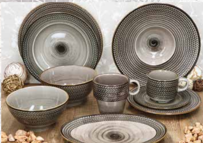
NEUES MÄSER PORZELLAN nur € 6,-/kg