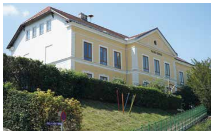
In Kritzendorf werden die elektrische Sicherheitsausstattung in der Volksschule und im Amtshaus modernisiert

Die Stadtgemeinde Klosterneuburg hat in dieser Woche mit umfangreichen Sanierungsarbeiten an den Elektroanlagen und Notbeleuchtungen in mehreren öffentlichen Gebäuden begonnen. Die Maßnahmen sind notwendig, um die betroffenen Gebäude auf den aktuellen Stand der Technik zu bringen und die Sicherheit für Lehrer und Kinder, Mitarbeiter und externe Nutzer auch weiterhin zu gewährleisten.