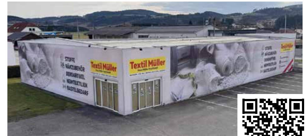
Die neue Textil Müller Filiale im oberösterreichischen Keferfeld Für einen virtuellen Rundgang scannen Sie den QR-Code

Der im Vorjahr fertiggestellte Verkaufsraum mit Artikeln zur Gartengestaltung wird derzeit erweitert, um für Kund*innen das Angebot übersichtlicher zu gestalten. Hier findet man jede Menge