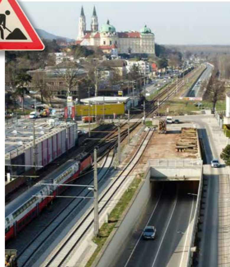
Der Johannatunnel wird generalsaniert.

Auch die umliegenden Verkehrsachsen sind betroffen: Auf der L116 zwischen Weidling und Hinterweidling kommt es im Juni durch Straßenverbreiterungen, Entwässerungsarbeiten und Fahrbahnsanierungen zu halbseitigen Sperren mit Ampelrege-