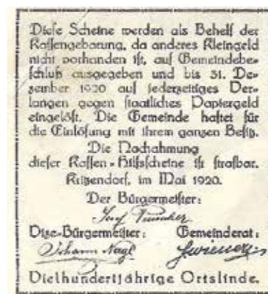
Privatbesitz Gabi Krieger-Wolf, Originalgröße des Notgeldes ist 4,6 x 5 cm

ses wieder in unsere Gemeinde zurückfindet, ist wirklich etwas Besonderes.“