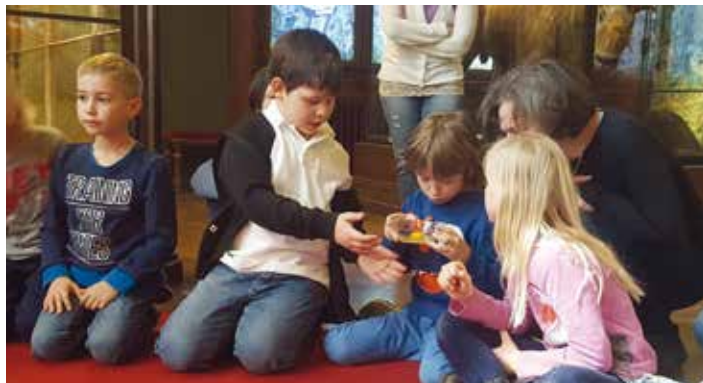
Team der VS Kritzendorf

Die Mädchen und Buben der beiden ersten Klassen nahmen an der Führung im Naturhistorischen Museum Wien teil. Ob hart oder weich, dickschalig oder schlabberig, rund oder kantig – Eier haben immer eines gemeinsam: In ihnen reift ein Junges heran. Im Museum konnten die Kinder Eier miteinander vergleichen und den verschiedenen Tierarten zuordnen. Ein Hühnerer wurde von außen und innen genau betrachtet. Anschließend besuchten wir bei einem Rundgang durch die zoologische Sammlung Spinnen, Krokodile, Frösche und viele andere Eier legende Tiere.