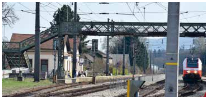
Der historische Bahnübergang wird ebenso renoviert wie das Bahnhofgebäude

Parallel dazu werden seit 13. März die Sanierungsarbeiten an der Fassade des Bahnhofgebäudes fortgeführt und sollten bis Ende Juni abgeschlossen sein.