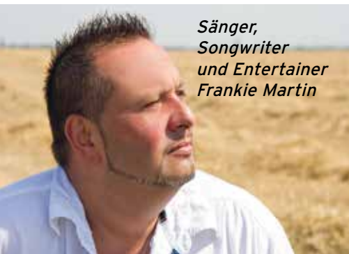
Sänger, Songwriter und Entertainer Frankie Martin

Das heurige Eröffnungsfest wird am Samstag, 22. 4. 2017 stattfinden. Für die musikalische Unterhaltung sorgt der Entertainer Frankie Martin. Für Speis und Trank ist natürlich auch gesorgt. Bitte rechtzeitig einen Tisch unter 0664-303 36 60 re-